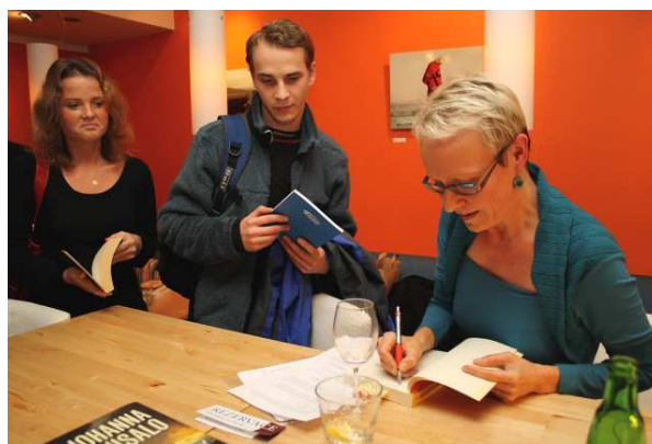
Finská spisovatelka Johanna Sinisalo podepisuje český překlad své knihy Ne před sluncem západem .