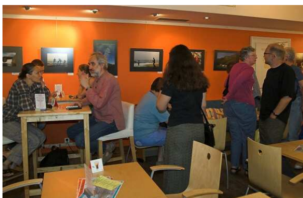
Vernisáž výstavy Island'ané mýma očima . foto: SD