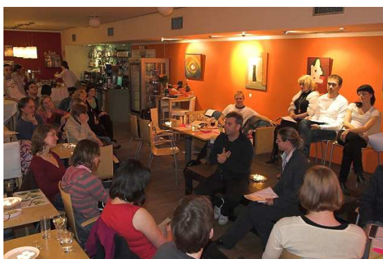
Literární večer Do ticha, do snu, do konce věnovaný současnému severskému dramatu.

V roce 2008 uspořádal Skandinávský dům 12 literárních akcí. Většina z nich se konala ve spolupráci s katedrou skandinavistiky a finštiny na Karlově univerzitě v Praze a katedrou norštiny na Masarykově univerzitě v Brně. Hosté byli většinou čeští překladatelé ze severských jazyků, ale pozvání přijalo také 5 zahraničních hostů - dva z Norska a po jednom z Finska, Dánska a Švédska. Setkání se spisovateli jsou pro české čtenáře jedinečnou příležitostí seznámit se s významnými osobnostmi současné severské literární scény, jejich názory, zkušenostmi i prací. Na programu je vždy autorské čtení, setkání s překladatelem a beseda s návštěvníky. Setkání probíhají v Café Nordica nebo v přednáškovém sále Skandinávského domu.