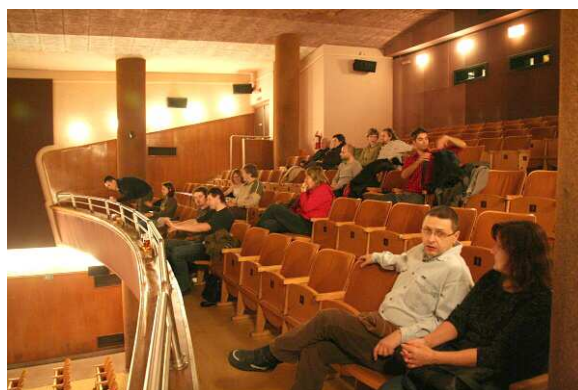
Vlevo: kavárna a pokladna kina Oko před promítáním Skandinávského domu, vpravo: balkón kinosálu.