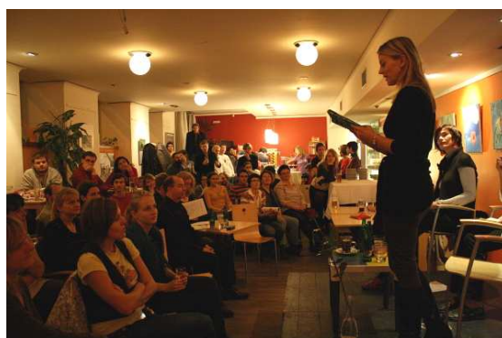
Norská spisovatelka Helene Uri předčítá ze své knihy Ti nejlepší z nás .