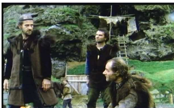
Ukázka z filmu Když letí havran (drama, IS, Hrafn Gunnlaugsson, 1984)

*Promítání, která se konala v učebně Skandinávského domu, jsou označena zkratkou SD. Ostatní promítání se konala v kině Bio Oko. Filmy, které byly k vidění také v pardubickém kině Klub 29 nebo v brněnském kině Art, jsou označeny zkratkami + K29, respektive + ART.