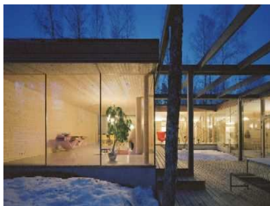
Ukázka y výstavy City Home. Rodinný dům; Örkkiniityntie 19, Kalajärvi, Espoo (2001-2003).