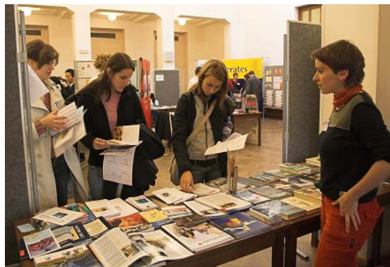
Stánek Skandinávského domu na Veletrhu studia v zahraničí .

Mezi ostatní akce, které Skandinávský dům v roce 2006 organizoval nebo spolupřádal, patří 7 menších koncertů , které se konaly v Café Nordica, a další neformální tematická setkání , jako například finsko-český předvánoční večírek Pikkuláš .