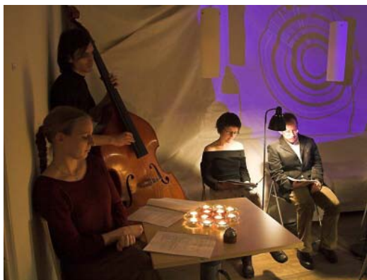
Scénické čtení Hedda v Café Nordica.

V dubnu 2006 bylo v Café Nordica uvedeno scénické čtení Hedda , které v podání studentů norštiny a švédštiny FF UK představilo tragédii Henrika Ibsena Hedda Gablerová v netradičním provedení. Studenti pojali představení tvůrčím způsobem a propojili v něm slovo, vizualizaci, živou hudbu a minimální scénu.