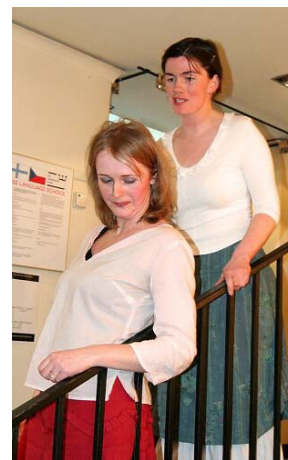
Ukázka z Ibsenovy hry Hedda na křtu sborníku ibsenovských studií .