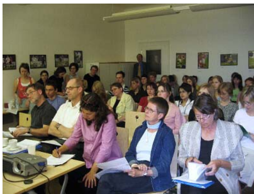
Konference o jazykových normách a jazykové toleranci ve skandinávských jazycích.