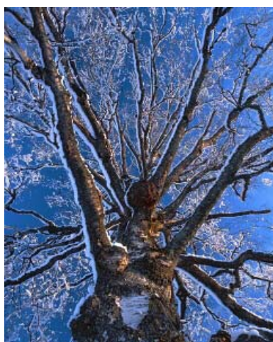
Melker Blomberg: z výstavy Photographs