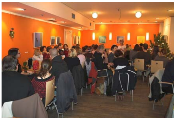
Česko-finské předvánoční setkání Pikkuláš v Café Nordica.