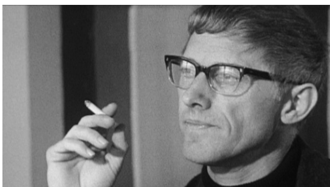
Ukázka z filmu Noget om Halfdan . Režisér J.P. Rasmussen film osobně uvedl.